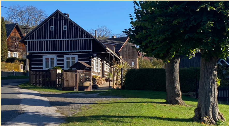
Na upravenou návěs ve Vojicích je radost se podívat. Je tu stále čisto a lípy se konečně dočkaly odborné péče.