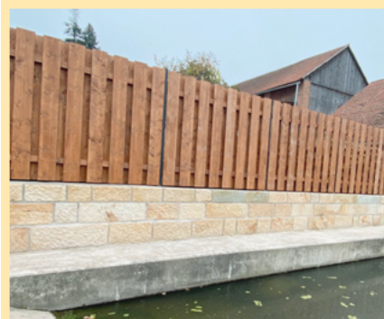
Říjen 2024 - zídka s dřevěným plotem.