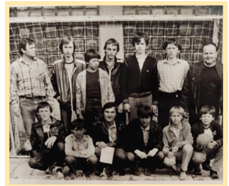
Péče o mládež byla vždy klíčovým prvkem pro udržení tradice házené u nás.