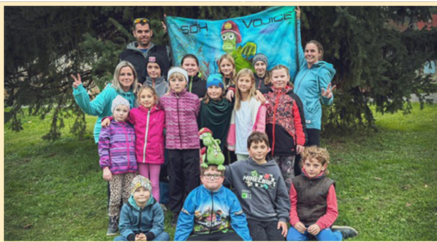
Po úspěšném závodu v Radimi samozřejmě muselo dojít i na společnou fotografii.

Během předchozích tréninků se na závody pilně připravovali nejen naši mladší členové, ale i jejich starší kolegové. Každý trénink byl doslova školou pro tělo i ducha, kdy děti pracovaly nejen na své lepší fyzické kondici, ale získávaly také potřebnou zručnost při obsluze hasičské techniky, rychlost a jistotu při poskytování první pomoci, orientaci v terénu a v dalších nezbytných branných schopnostech.