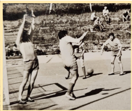
Tým byl příkladem toho, jak poctivý přístup a zaměření na detail vedou k úspěchu.