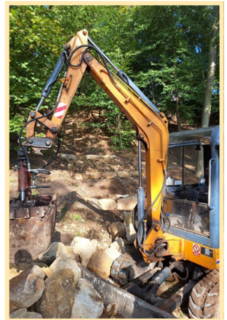
Pro úpravy terénu a taky pro jeho vyčištění bylo třeba ve Skalce použít techniku.

O vzrostlé a letité stromy pro nás nyní odborně pečuje arborista a změna je, myslím, docela znát.