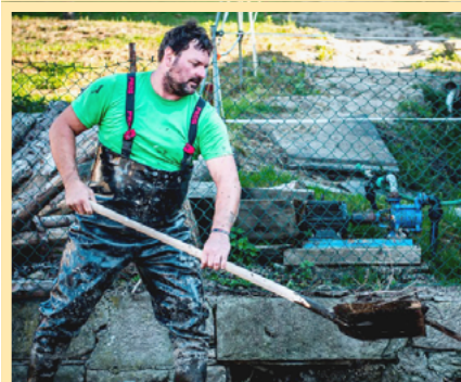
Srpen 2023 - likvidace naplaveného bahna a čištění nádrže.

Od loňské havárie, při níž po prudkých lijácích přišly v našem brodku všechny vysazené rybky o život, doznalo toto místo podstatných změn. A další jej ještě čekají. U prodejny COOP v Podhorním Újezdu pak vznikne upravený prostor, kde bude příjemné posedět a prohodit pár slov se sousedy. Plánovaná výsadba rostlin v nádrži i kolem ní bude sice muset počkat na jaro, ale změna je už teď obrovská.