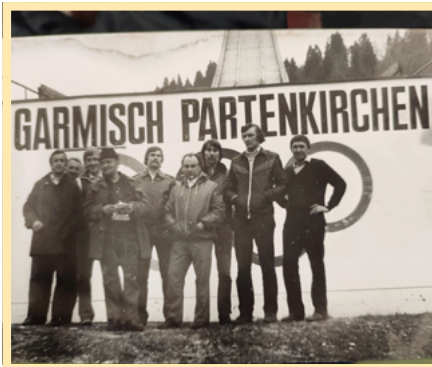
Ve své nejlepší éře měli muži možnost srovnat své síly i se zahraničními celky.