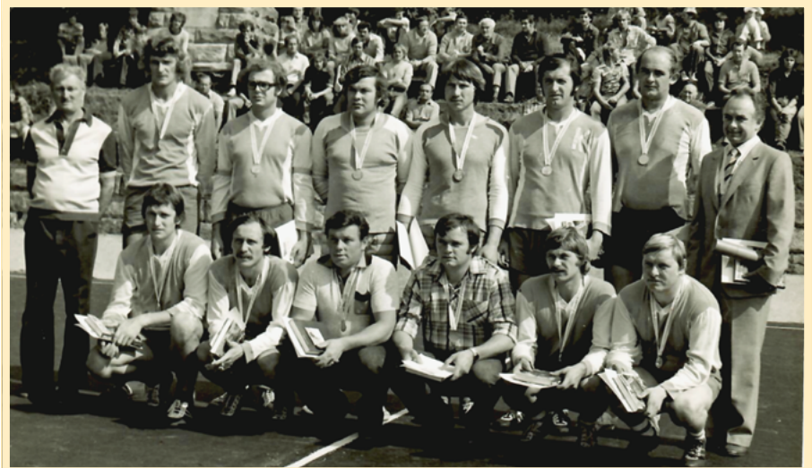
Družstvo, které v české národní házené dominovalo a vyhrálo tři tituly po sobě. V období zlaté éry (v 80. letech) byl jejich triumf skutečně výrazný a zasloužený.