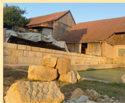
Červenec 2024 - stavba nové zídky.